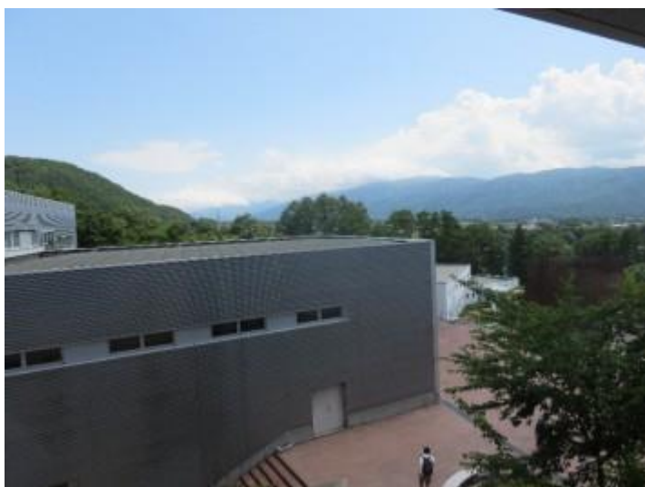
自然科学部門の会場の諏訪東京大学からの風景。研究発表は四号館で行いました。周りを自然に囲まれており、まさに自然科学部門の研究発表をするにふさわしい舞台でした。