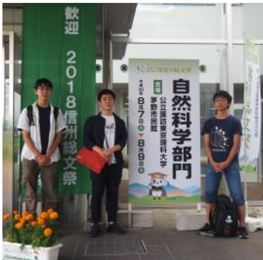
会場入口で記念撮影。